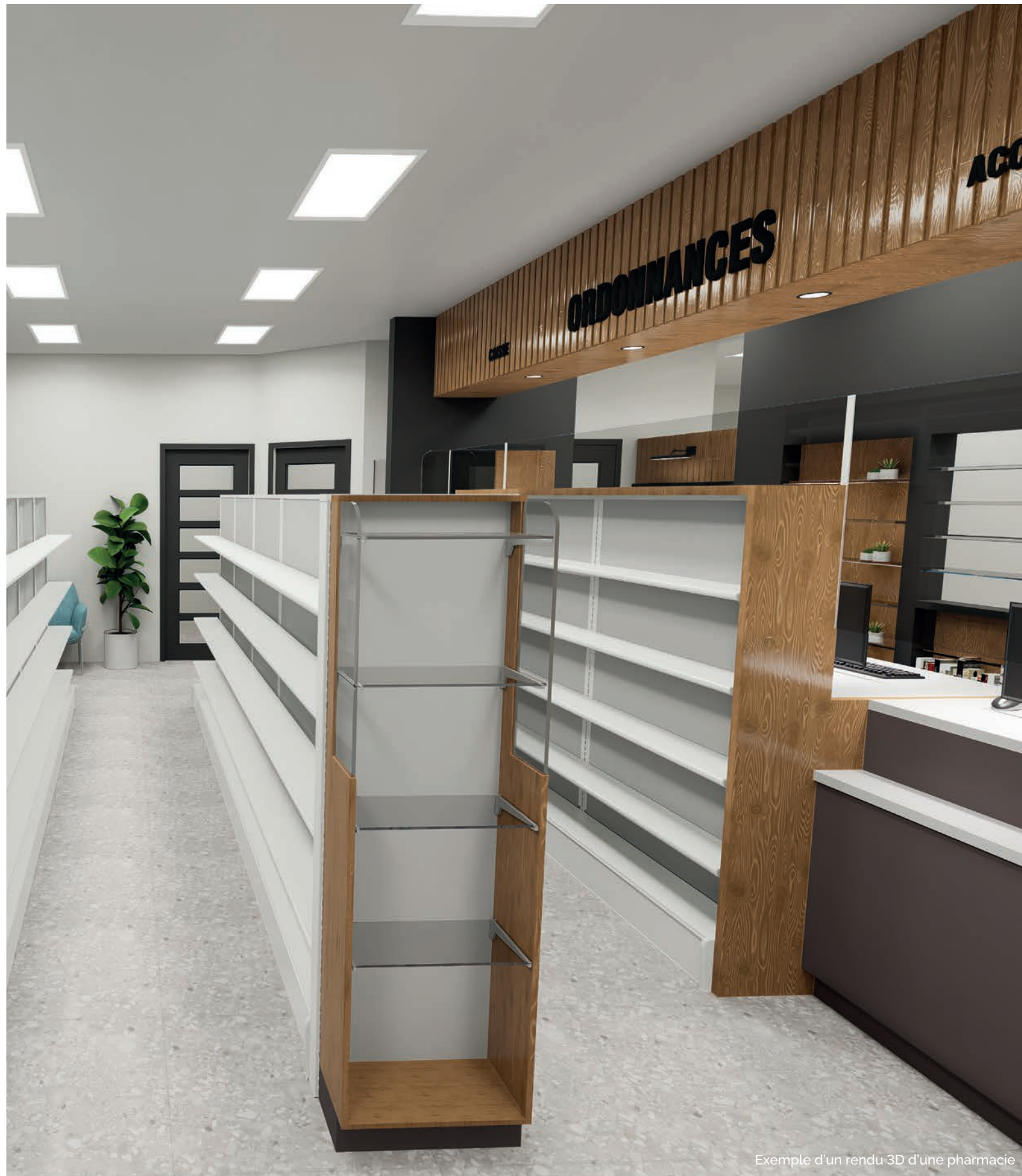
Exemple d'un rendu 3D d'une pharmacie